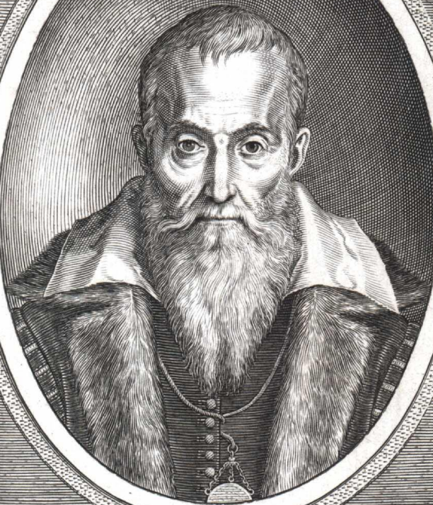
IOSEPHUS IUSTUS SCALIGER IUL. CÆSARIS A BURDEN F.