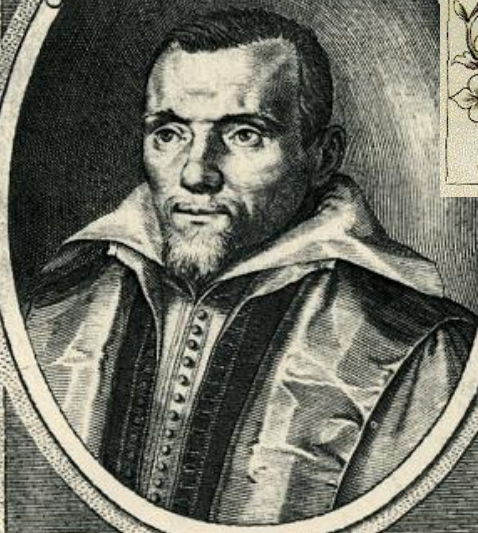
DANIEL HEINSIUS BIBLIOTHE- CARIUS ET POLITICES' PROF.